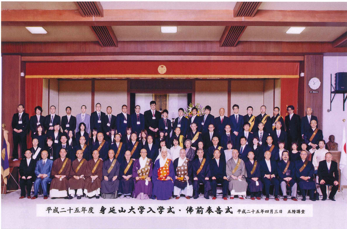
平成二十五年度 身延山大学入学式・佛前奉告式 平成二十五年四月三日 五階講堂

平成二十五年四月三日(水)に身延山大学五階講堂にて平成二十五年度身延山大学入学式が執り行われ、仏教学科十五名、福祉学科十三名、仏教学科編入生七名、福祉学科編入二名、韓国金剛大学より二名の留学生、計三十九名を新入生として迎え、浜島典彦学長が祝辞を述べた。