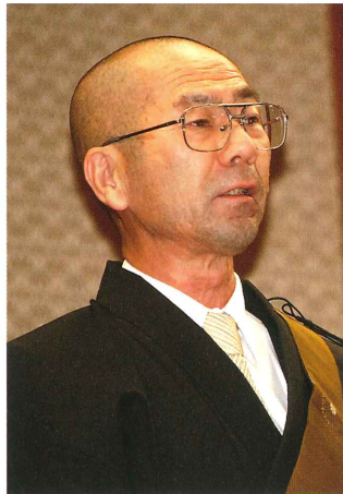
保護者会会長挨拶

りしづかに見てありくとき」「たのしみは三人の兒どもすくすくと大きくなる姿みる時」このようなことを学生・教職員が体感できるアットホームな大学がわが身延山大学であります。どうかこの地でこれからの人生の糧となる礎を築きあげてください。期待しております。