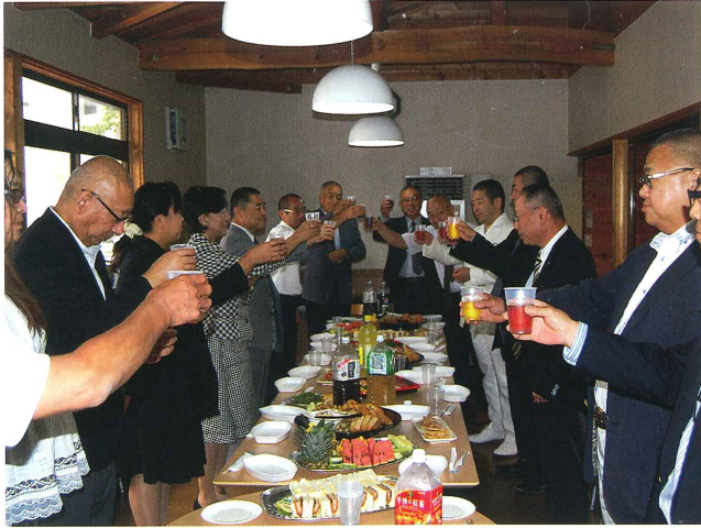
講演終了後、学食に移動し、教職員と保護者会員の懇親会が行われた。