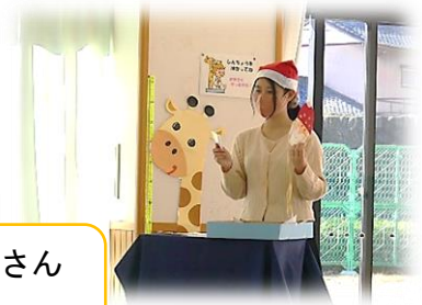
かわいいサンタさんができたね♪

身近にある紙皿と折り紙を使って、サンタクロースの顔のポシエツトをつくりました。完成したサンタさんに子どもたちもニコニコ笑顔です。