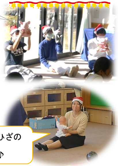
お子さんをおひざの上に乗せて…♪