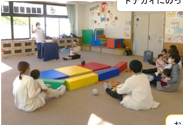
トナカイにのって～☆